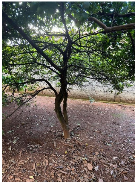
Figura 04: Limoeiro.