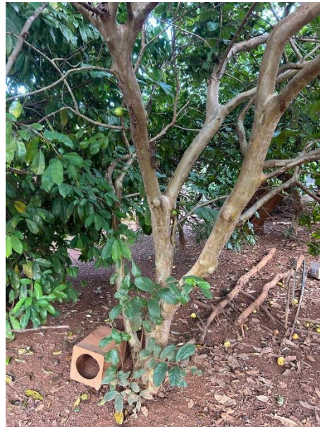
Figura 02: Goiabeira.