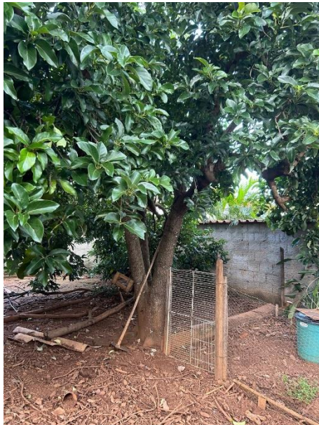
Figura 01: Abacateiro.

Segue o registro fotográfico das espécies.